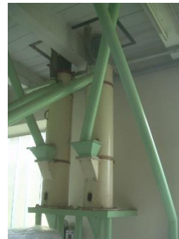
7) Kleischleuder 2 u. 3