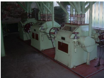
11) Verrohrung 1