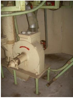
1) Mahlstein 1