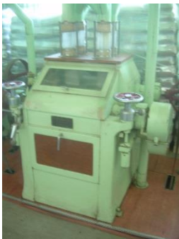
8) Walzenstuhl 1