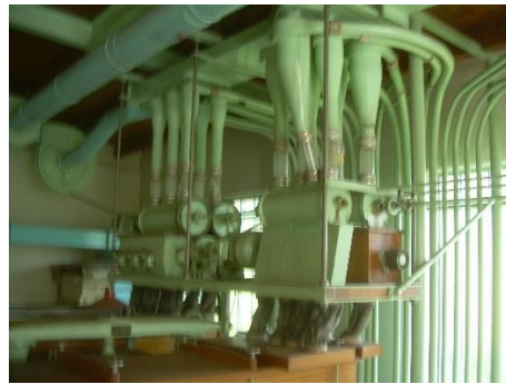
18) Schleusen 2