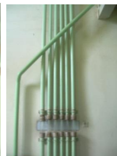
13) Verrohrung 2