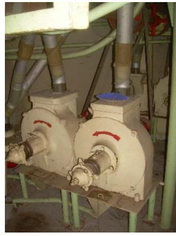
3) Mahlsteine 2 u.3