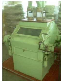
10) Walzenstuhl 3