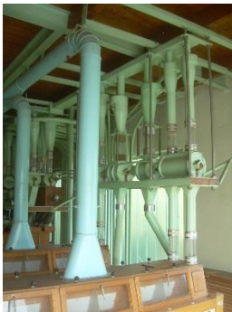
17) Schleusen 1