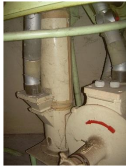
2) Kleieschleuder 1