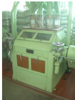
9) Walzenstuhl 2