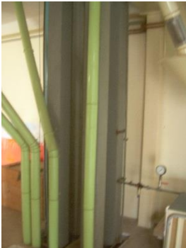
6) Elevator 2,3