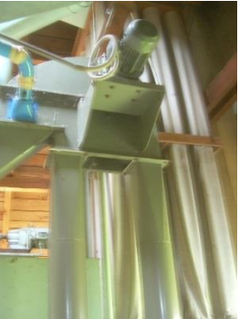
3) Elevator 1 motor