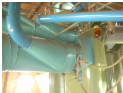
23) Input Jetfilter