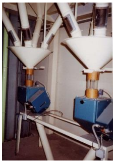
19) Flow Balancer