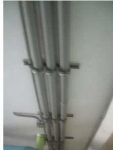
29) Cabeling 1