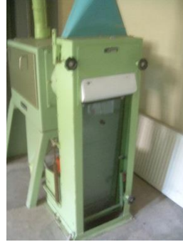
12) Aspiration channel