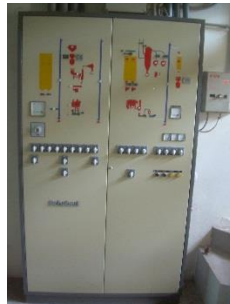
26) Control sytem