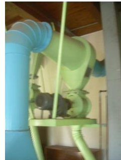
15) Cellular sluice