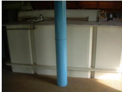
18) Storage silo top