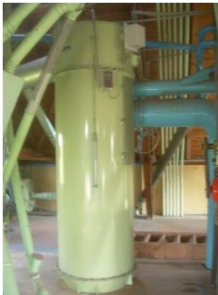
22) Jetfilter 2