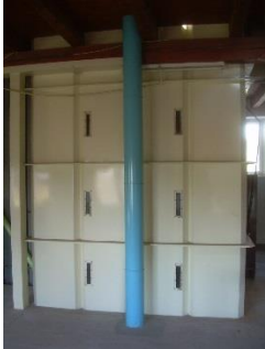
17) Storage silo