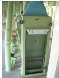
14) Aspiration ch. 2