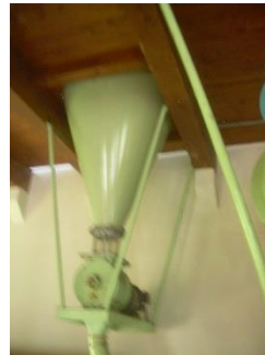
24) Cellular sluice