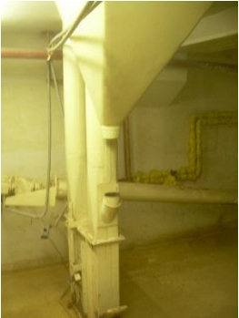
2) Elevator 1