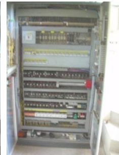
27) Control sy. inside