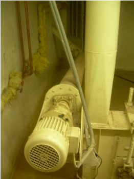
1) Silo screw conveyor