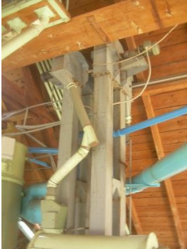
7) Elevator 2, 3 motor