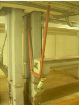
5) Elevator 3