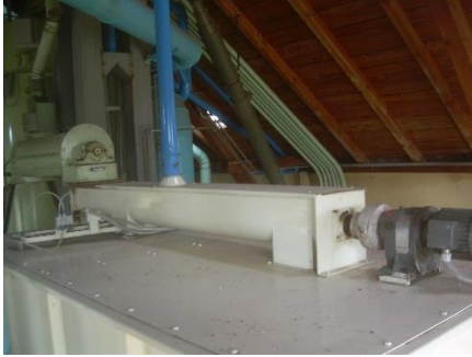
21) Distribution screw conveyer