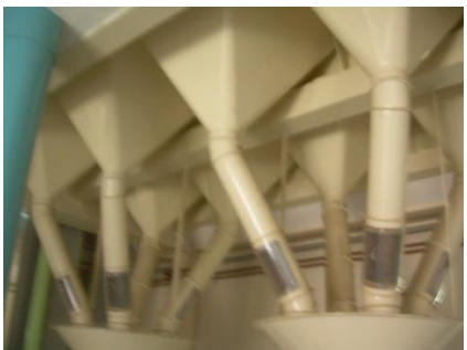
16) Spout storage silo