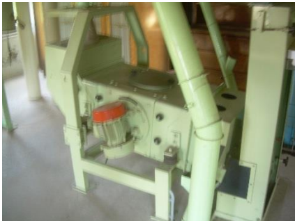
13) Leightweight collector