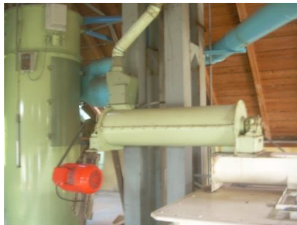
20) Mixing screw convoyer