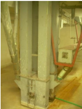
4) Elevator 2