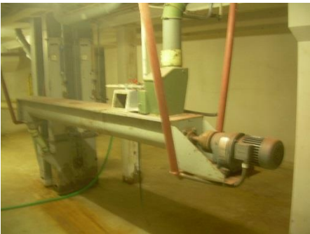
8) Intensive wetting auger